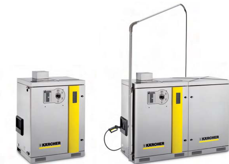
Základní přístroj SB-Wash (lakovaná verze)

Příhrádka vestavěná do krytu umožňuje bezpečně uložit mycí příslušenství a současně garantuje uzavřený protimrazový oběh.